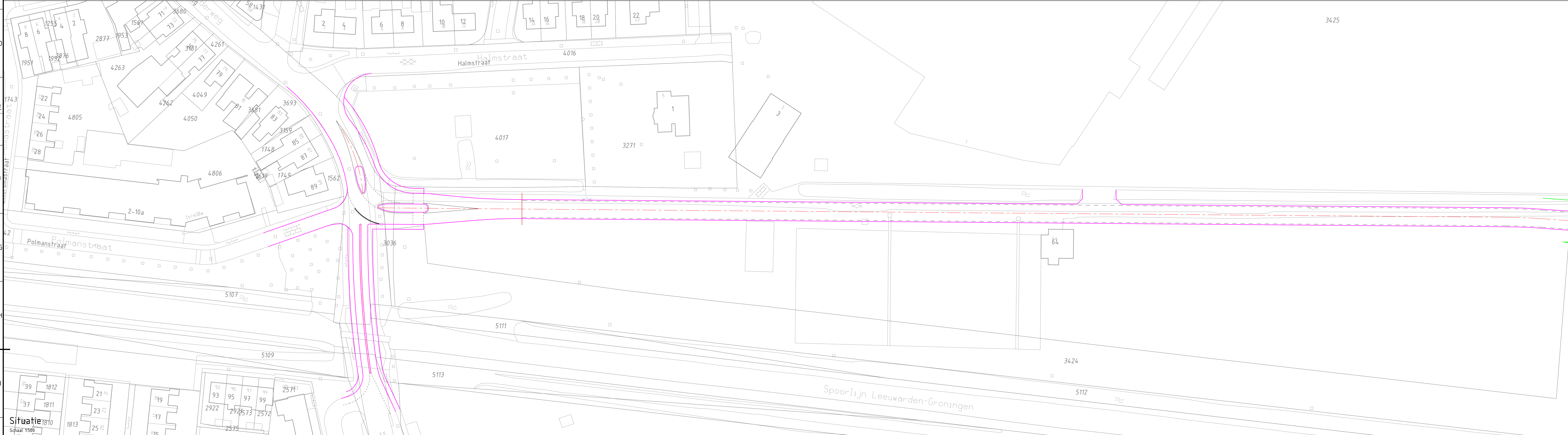
Situatie Schaal 1:500